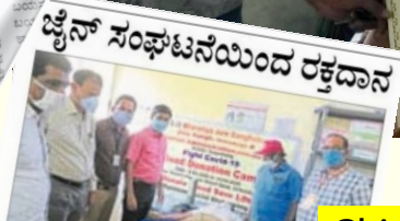
Chitradurga News, Karnataka