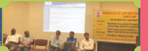
एफजेईआई-प्रिसिपल सेमीनार, 16 सितम्बर, 2017, चेन्नई