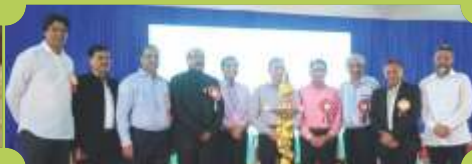
एफजेईआई, कर्नाटक राज्य अधिवेशन, 24 सितम्बर, 2017, बंगलौर