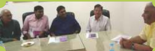
एफजेईआई, राजस्थान राज्यकार्यकारिणी सभा, 24 सितम्बर, 2017, जोधपुर